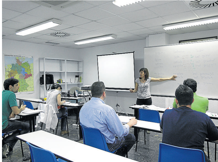
◆ PREPARACIÓN Los colegios profesionales inciden en la formación académica y laboral. HA

La preparación y cualificación del individuo son unas de las principales bazas para evitar las elevadas tasas de desempleo, según los colegios profesionales. Con este afán, se ha creado un Observatorio de Empleo y Empleabilidad, para informar y facilitar la orientación de los interesados a través de informes periódicos; además de fomentarse las relaciones con otras entidades que pueden propiciar o que también están interesadas en la empleabilidad del profesio-