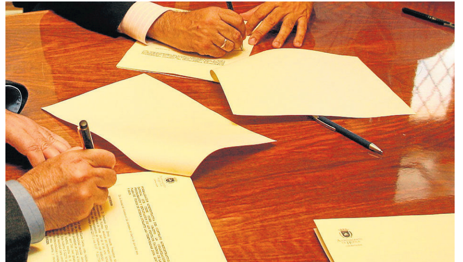
◆ CONTRATOS Muchos requieren el asesoramiento de personas capacitadas con formación y experiencia. HA

CABE PENSAR QUE EN TIEMPOS DE CRISIS PERMANECEN LOS MÁS FUERTES, PERO ¿TAMBIÉN LOS MÁS CAPACITADOS? DESDE LOS COLEGIOS CORPORATIVOS APUESTAN POR QUE ASÍ SEA Y PARA ELLO INSISTEN EN REGULAR LA ACTIVIDAD PROFESIONAL